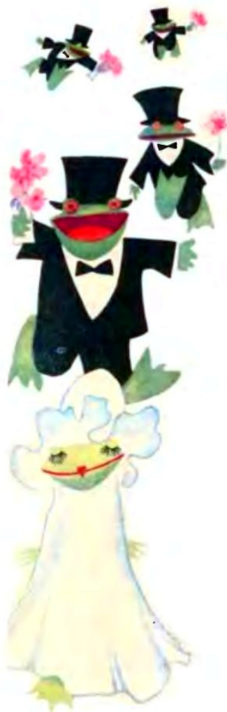
Рис. 2 Fig. 2