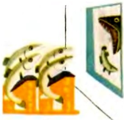
Рис. 1 Fig. 1