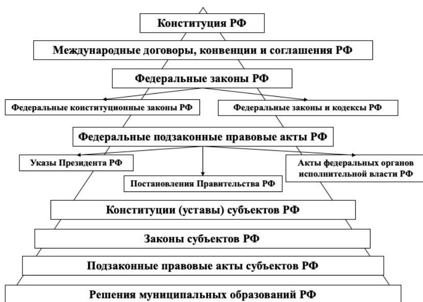
Рис. 1. Иерархическая структура законодательства Российской Федерации

Ядерная зона 3Д РФ была дифференцирована по полевому признаку на две составляющие: ядерная зона первого порядка, состоящая из одного РЖ – КОНСТИТУЦИИ РФ, и ядерная зона второго порядка ( Международный договор, Международная конвенция, Международное соглашение, Федеральный закон, Федеральный кодекс, Указ Президента РФ, Постановление Правительства РФ ). Параметрами моделирования ядерной зоны 3Д РФ стали признаки, яркость которых убывает по мере удаления от ядра (т. е. КОНСТИТУЦИИ РФ): 1) усиливается хронологическая нестабильность нормативно-правового акта, соотносимого в РЖ (например, указы Президента принимаются чаще, чем федеральные законы, а федеральные законы, в свою очередь, менее стабильны, чем Конституция РФ и т. д.); 2) уменьшается коллегальность принятия нормативно-правового акта (например,