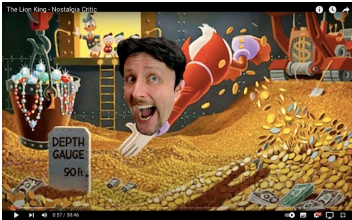
Рис. 3. «Ностальгирующий критик» в образе Боба Айгера (главы Диснея) намекает на то, что студия увлеклась эксплуатацией собственного наследия из-за финансовой выгоды