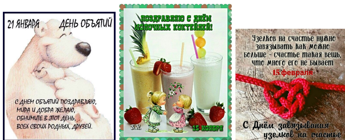
Рис. 2. Интернет-открытки с нетрадиционным содержанием

Очевидно стремление пользователей разделять пожелания в соответствии с полом и возрастом адресата: пожелания женщине – 836 750 запросов, пожелания с днём рождения женщине – 667 710, пожелания с днём