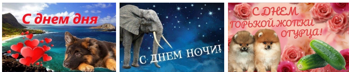
Рис. 3. Интернет-мемы

Лингвистическая метаоценка интернет-пожеланий во многом связана со стереотипностью предлагаемых текстов. Нередко эта оценка совмещена с эмоциональной и эстетической. Универсальные поздравительные виртуальные открытки представляют собой однотипные изображения, как правило, с букетами цветов, которые не содержат обращения к адресату и ограничиваются надписью