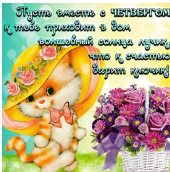
Рис. 4. Пожелания на виртуальных открытках