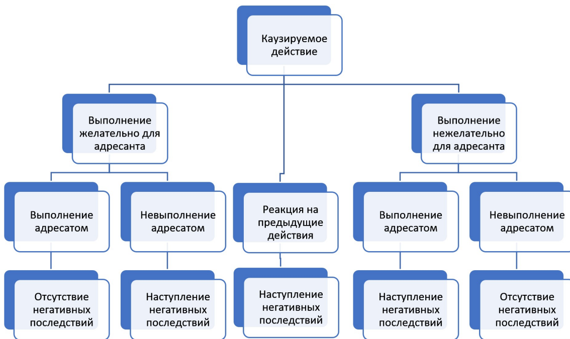
Рис. 3. Коммуникативные параметры угрозы относительно каузируемого действия

(косвенным). Эксплицитная угроза выражена явно, и для ее интерпретации нет необходимости совершать дополнительные семантико-грамматические действия: «Сегодня я тебя зарежу». Дешифрование имплицитной угрозы в рамках проведения судебной лингвистической экспертизы предполагает обращение к логико-грамматическому компоненту высказывания, анализ коммуникативной ситуации, работу с контекстом и применение других дополнительных семантико-грамматических действий, которые позволяют выявить различные лингвистические приемы, используемые при угрозе для маскировки ее под другие интенции, речевые акты и т. п. Признаком устного имплицитного высказывания угрозы чаще всего является особая угрожающая тональность («модельная тональность» [19]), которая обеспечивает создание просодического/мимического компонента, характерного, прежде всего,