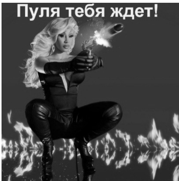
Рис. 5. Угроза в форме креолизованного текста Fig. 5. Threat in a form of a creolized text

Особым экстралингвистическим приемом в угрозе, типичной для интернет-коммуникации, выступает визуализация, средствами которой могут быть как статические, так и динамические изображения, где присутствует элемент демонстрации оружия – холодного или огнестрельного (рис. 5).