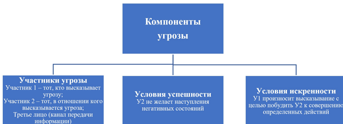
Рис. 1. Структурные компоненты угрозы