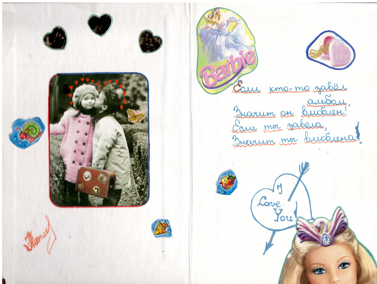
Рис. 2. Пример реализации любовной тематики в девичьем альбоме Fig. 2. An example of love topic usage in a girl's diary

«Чихалки», «Икалки», «Чесалки», «Спотыкалки». Эта разновидность гаданий, являя собой пример «тотальной любовной семиотизации повседневности» [4: 38], направлена на семантизацию определенных физических проявлений (чих, икота и пр.), значение которых зависит от дня недели и часа их проявления. На одной из страниц девичьего альбома читаем: