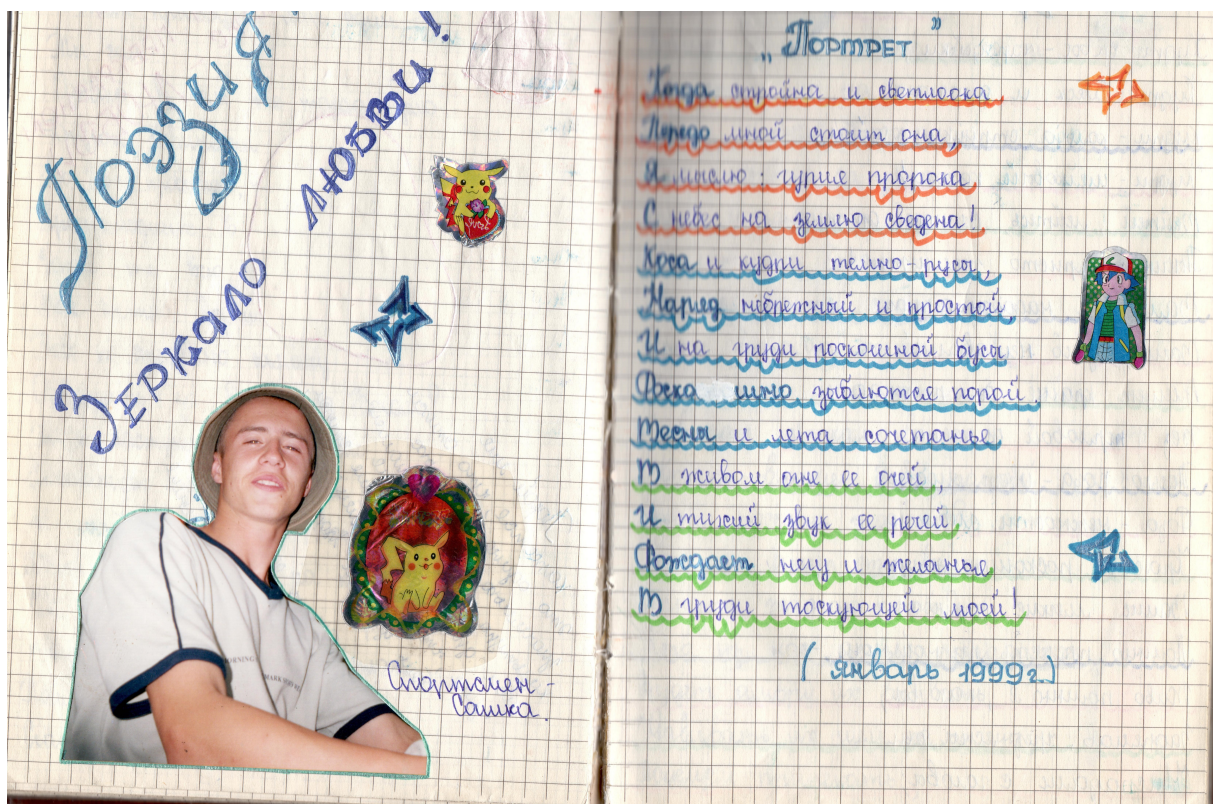
Рис. 1. Пример использования текстов классических авторов (стихотворение А. С. Пушкина «Портрет») Fig. 1. An example of classical texts usage (Alexander Pushkin's poem "A Portrait")

«Гадалки». Представляют собой описание методик, позволяющих узнать свое будущее, к примеру, имя суженого, отношение молодого человека к хозяйке альбома и др. Подобного рода фатическое поведение выступает как речевая форма реализации развлекательной функции девичьего альбома, связанной с возможностью удержать внимание собеседника посредством непринужденного времяпрепровождения, игры. В качестве иллюстрации этого раздела гадание «ЛУРНИСТ» (Любит, Уважает, Ревнует, Ненавидит, Ищет, Снишься, Тоскует), основанное на предсказании будущих событий посредством учета числа букв в фамилии или имени молодого человека, отношение которого к себе хочет выяснить гадающий. О девичьих графических гаданиях см. [4: 33].